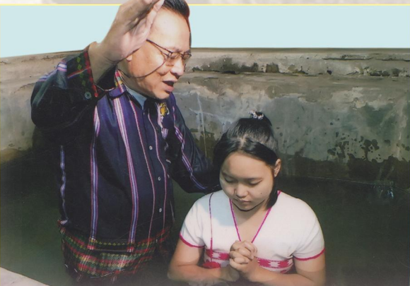
သရၣ်ဒိၣ်ဟဲစိၣ်ဟ့ၣ်တၢ်ဒီးဘျာဖဲမၤကွၢ်ဒဲးအိၣ်ဖျိၣ်ယုၤလံၤစ့ကတီၢ်

ယွၤမၤတၢ်အဒိၣ်လၢပကီၢ်အပံ မ်ပကမၤလၢကပီၤစံးထီၣ်ပတြၢအီၤ တဘိယုၢ်ဃီတက့ၢ်.